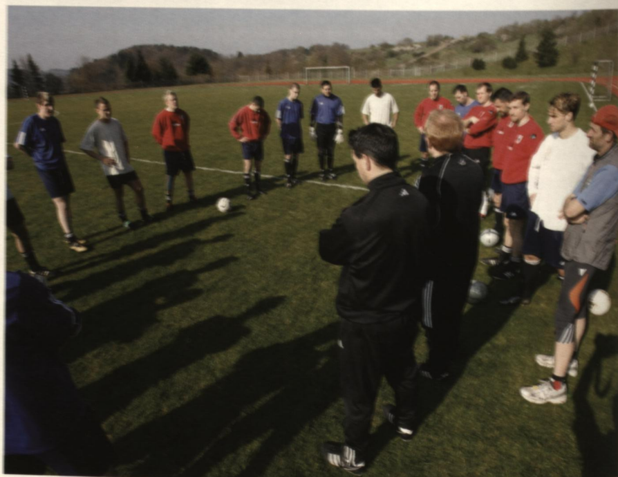
Trainingsbesprechung mit Trainer und Mannschaft.