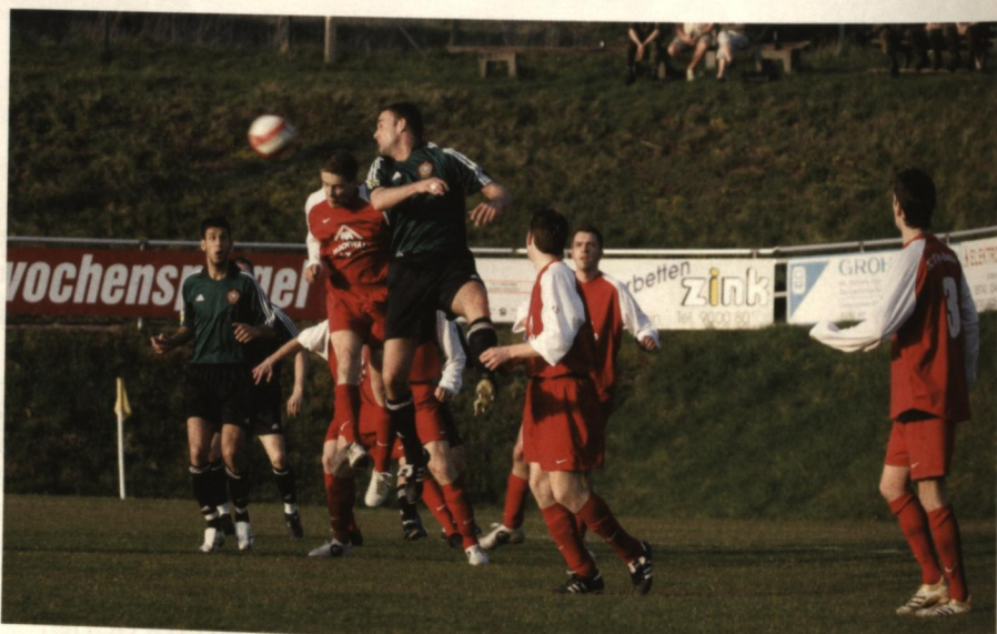
Einsatz zeigen für In dien: Kampf um jeden Ball.